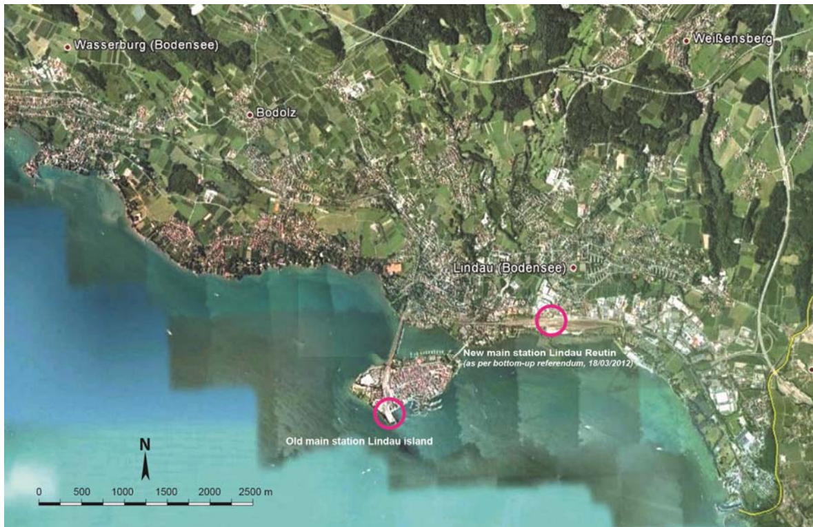
Abb. 2: Siedlungsstrukturen in Lindau 2012