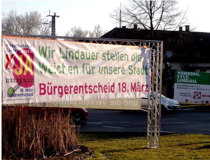
Abb. 4: Aufwändige Plakatierungen für und wider die Verlagerung des Hauptbahnhofs in Lindau