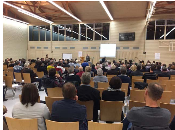
Abbildungen 1 und 2: Informationsveranstaltung in der Gemeinde Mauern

Auf der Informationsveranstaltung hatten die Bürger/innen zwar viele inhaltliche Fragen – zur Technik, zur Gesundheit, zur Vorgehensweise oder zur Finanzierung der WKA. Doch auch hier offenbart der Blick hinter die Anliegen und Diskussion das, was auf dem Spiel steht: Die WKA bedeutet eine Veränderung und greift in das Zuhause ein. Die Bürger/innen forderten etwas Grundlegendes von ihrer Gemeinde und den Vorhabenträger/innen: die Anerkennung und Berücksichtigung ihrer Bedürfnisse und Sorgen, Transparenz, die Übernahme von Verantwortung, Schutz und Sorgfaltspflicht. Darüber hinaus zeigt dieses Beispiel, dass Beteiligung von Gegenseitigkeit lebt. Der Bürgermeister appelliert an die Pflichten der Bürger/innen, auch für das einzustehen, was auf der Veranstaltung beschlossen wird. Seine Aussage »wir werden nicht über euch weg entscheiden, aber ihr müsst auch die Entscheidung am Ende mittragen«, bringt auch diese Dimension von Zugehörigkeit hervor.