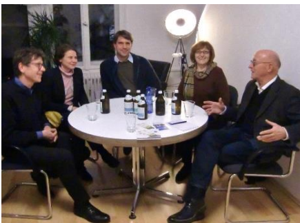
Abbildung 4: Bürgerlobby Klimaschutz im Gespräch mit MdB Bernhard Loos (CSU)

Sie schreiben Briefe an Politiker/innen und vereinbaren mit ihnen