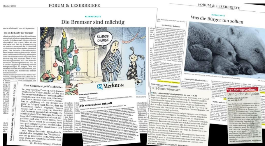
Abbildung 5: Ausschnitt veröffentlichter Leserbriefes

• sozialverträgliche Verwendung der Einnahmen: Wenn der CO2-Preis künftig deutlich steigt, kann Akzeptanz nur erreicht werden, wenn die Einnahmen nicht beim Staat verbleiben. Über die Senkung der Stromsteuer hinaus wird eine Pro-Kopf-Rückerstattung an die Bevölkerung als Klimadividende vorgeschlagen: Haushalte mit geringem Einkommen profitieren davon.