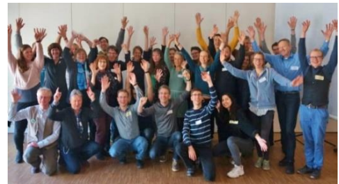
Abbildung 3: ehrenamtlich Aktive beim Jahrestreffen mit Lobbytagen in Berlin

Termine für Lobbygespräche. In diesen Gesprächen legen die Aktiven besonderen Wert darauf, unseren Vertreter/innen im Bundestag mit Respekt und Wertschätzung gegenüberzutreten. Dabei besteht immer die Absicht, eine gemeinsame Basis zu finden. Die Bürgerlobbyist/innen bemühen sich, die Grundanliegen der Politiker/innen herauszuhören und Anknüpfungspunkte für ein politisches Engagement zum Klimaschutz zu entdecken. Von ihrer eigenen Betroffenheit und ihren persönlichen Sorgen bezüglich der Klimakrise ausgehend, übermitteln sie wertvolle Informationen an die politischen Entscheidungsträger/innen und bringen auch konkrete Politikvorschläge ins Gespräch ein.