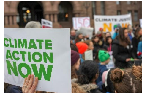
Abbildung 1: Fridays for Future-Proteste

Es sind vor allem junge Leute die das Thema Klimaschutz bewegt. Seit Monaten vergeht kaum eine Woche, in der sie uns dies nicht bunt und lautstark vor Augen führen – seien es die Demonstrationen von »Fridays for Future«, medienwirksame Aktionen zivilen Ungehorsams von »Extinction Rebellion« oder die Aktivitäten von »Ende Gelände«, um nur einige zu nennen. Die Jugend wird politischer und nutzt die vielfältigen Proteste als Instrumente einer lebendigen Demokratie. Zumindest die schulstreikenden Kinder und Jugendlichen erhalten von vielen Seiten wohlwollende Zustimmung und werden von Wissenschaftler/innen, Eltern und Großeltern auch öffentlich unterstützt. Die von ihnen geforderten Ergebnisse sind aber weiterhin nicht in Sicht: Die Emissionsminderungsziele der Regierungen bleiben weit hinter der Klimavereinbarung von Paris zurück, auch die neuen deutschen Gesetze und Verordnungen des »Klimapakets« sind zu zaghaft und greifen zu langsam. Vor allem aber: Die weltweiten Treibhausgas-Emissionen steigen weiter.