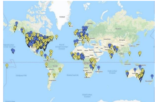
Abbildung 2: Citizens' Climate Lobby Ortsgruppen

Im Jahr 2007 folgten 29 Zuhörer/innen einer Einladung zu einer dreistündigen Präsentation in den Räumen der Stadtbücherei in Coronado, einer Kleinstadt in Kalifornien, nahe San Diego. Eingeladen hatte Marshall Saunders, ein »rüstiger Rentner« mit jahrelanger Erfahrung in Bürgerlobbyarbeit zur Beendigung von Hunger und Armut und ausgebildeter »Climate Reality Leader« der NGO des früheren US-Vizepräsidenten Al Gore. Am Ende der Veranstaltung gründeten die Teilnehmer/innen die ersten drei Gruppen der Citizens' Climate Lobby – heute eine Bürgerlobby mit mehr als 200.000 Unterstützer/innen und 570 Ortsgruppen in 55 Ländern auf allen Kontinenten.